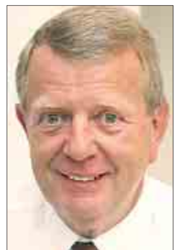
Autor Rolf Rossius kennt Münchens Top-Wohnadressen.

hat Rossius selbst mit dem Fahrrad oder zu Fuß inspiziert. Demnach können sich auch weite Teile Schwabings,